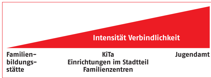
Abbildung 2: Angebote für Eltern. Intensität und Verbindlichkeit

Implizit einbezogen in diese Betrachtung sind zwei weitere Dimensionen, die zu einer Strukturierung der Familienbildungslandschaft beitragen: Fachkräfte und Orte. Deshalb wird im Folgenden Familienbil-