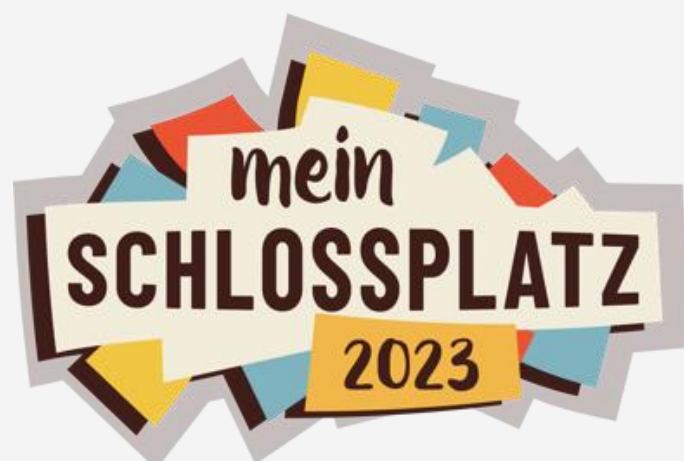
April bis Juni 2022/2023