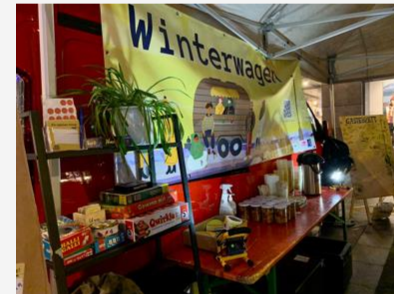
Winterwagen Dezember 2022