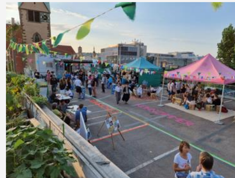
Abschlussveranstaltung #0711 Wohnzimmer auf dem Parkdeck