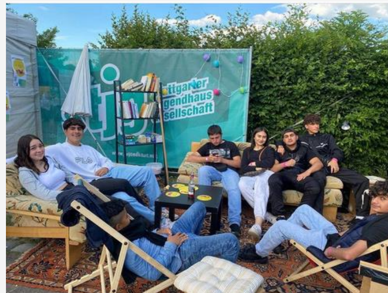
#0711Wohnzimmer 22. April und 27. Juli 2022