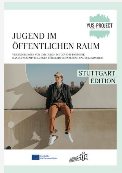
Februar 2022 bis März 2023