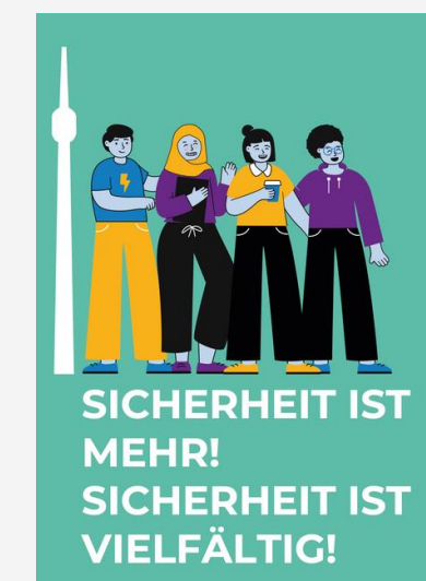
Broschüre Dezember 2022 Tour durch das Rathaus bis 2023