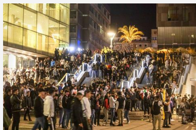
COVID-19-Pandemie + sogenannte Stuttgarter Krawallnacht im Juni 2020